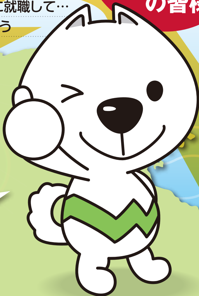
和歌山県PRキャラクター「きいちゃん」

和歌山には 日本や世界で活躍する 魅力的な企業がたくさんあるよ。 県内就職のメリットや県内企業のことを 知ってもらおうセミナーです。